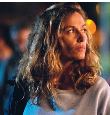
Cécile de France dans Dalloway .