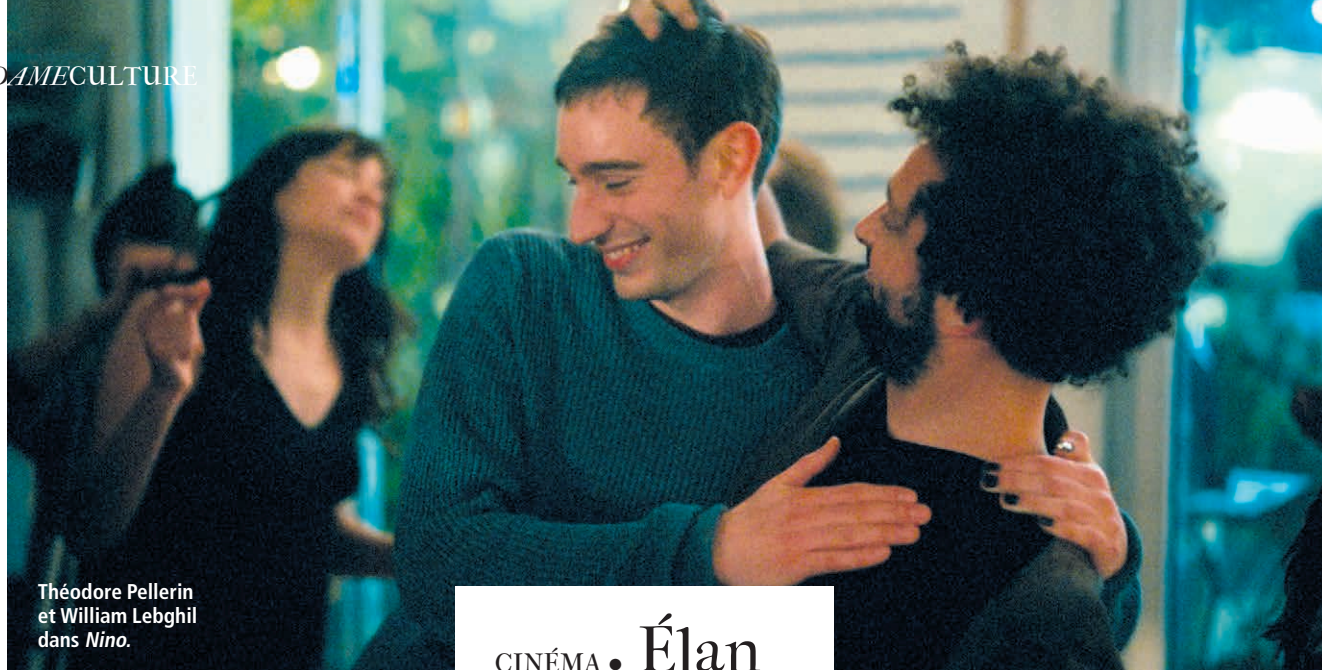
Théodore Pellerin et William Lebghil dans Nino .